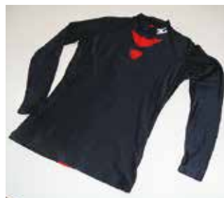
（スポーツ用シャツ地加工）