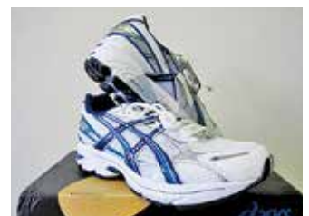
（シューズメッシュ材加工）

セーレン(株)勝山工場は、染色・整理業としての120年の技術を活かし多様な生地（組織、素材）に付加価値を付与し、日本国内はもとより海外アパレルに対してもメイド・イン・ジャパンの情熱で高品質を提供しています。これからも「不可能を可能に」を合言葉とし、消費者の立場でものづくりを行っていきます。