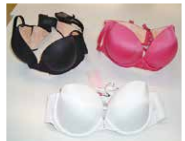
（女性用下着材加工）