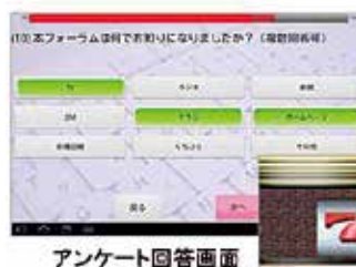
アンケート回答画面