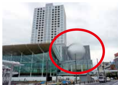
（福井ドームシアター外壁）