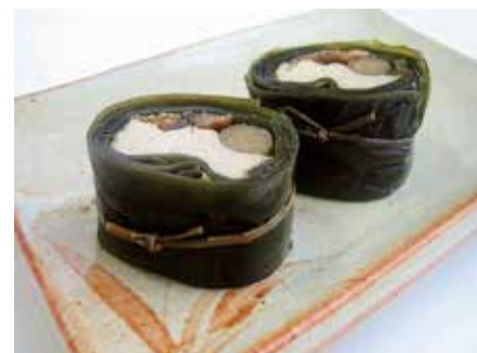
（とろっとろの昆布巻き）