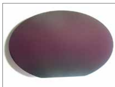
【シリコンウェーハ】